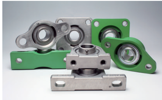
裏ペタのハウジングはユニット底面にゴミがたまるのを防ぎます。